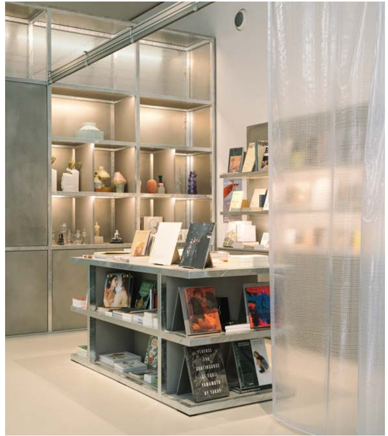
© Léna Domergue / Camille Lecomte, Lafayette Anticipations