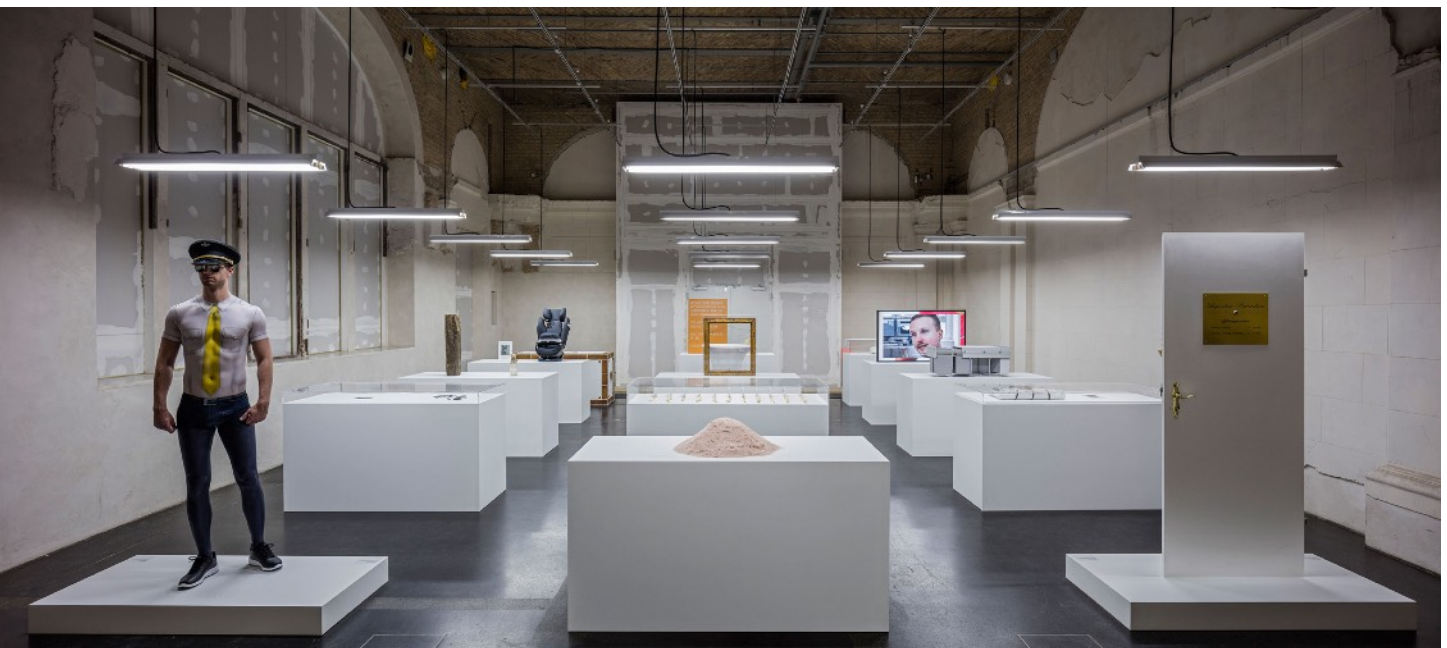
Simon Fujiwara, Likeness , 2018