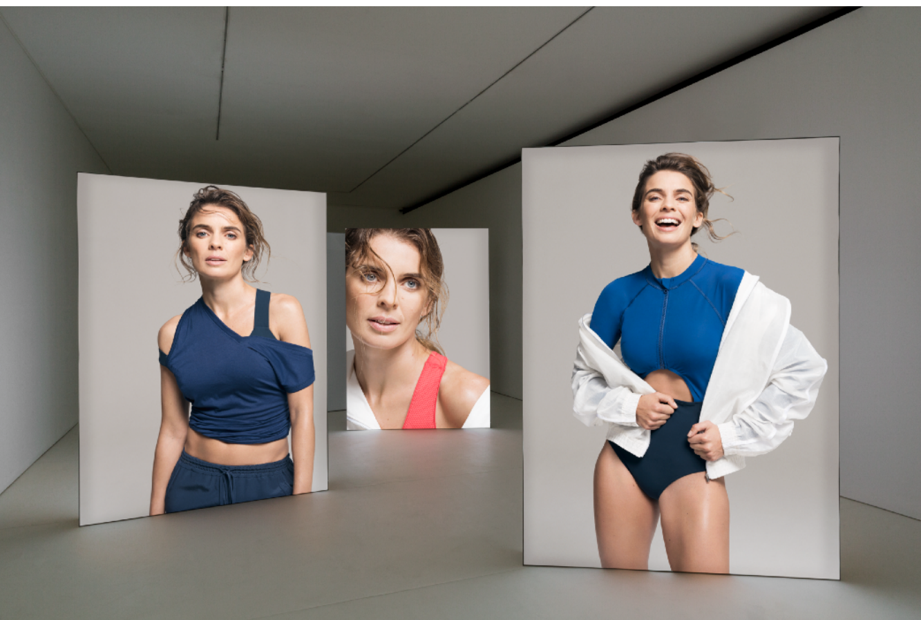
Simon Fujiwara, Empathy I , Esther Schipper, Berlin, 2018 (Vue de l'exposition)