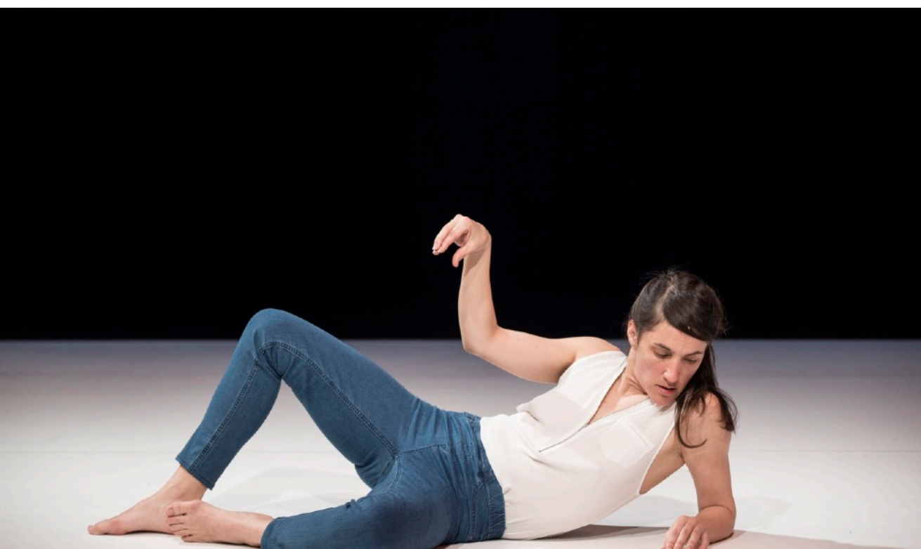
Yasmine Hugonnet, Se Sentir vivant , 2017