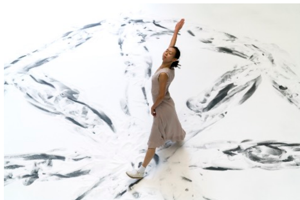
Anne Teresa de Keersmaeker, Violin Phase . Festival Echelle Humaine, édition 2018 avec le Festival d'Automne à Paris