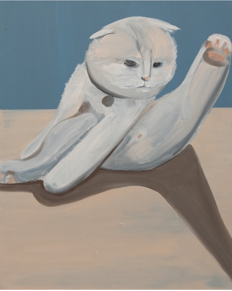
© Hesem Rahmanian, The Pets We Love , 2018