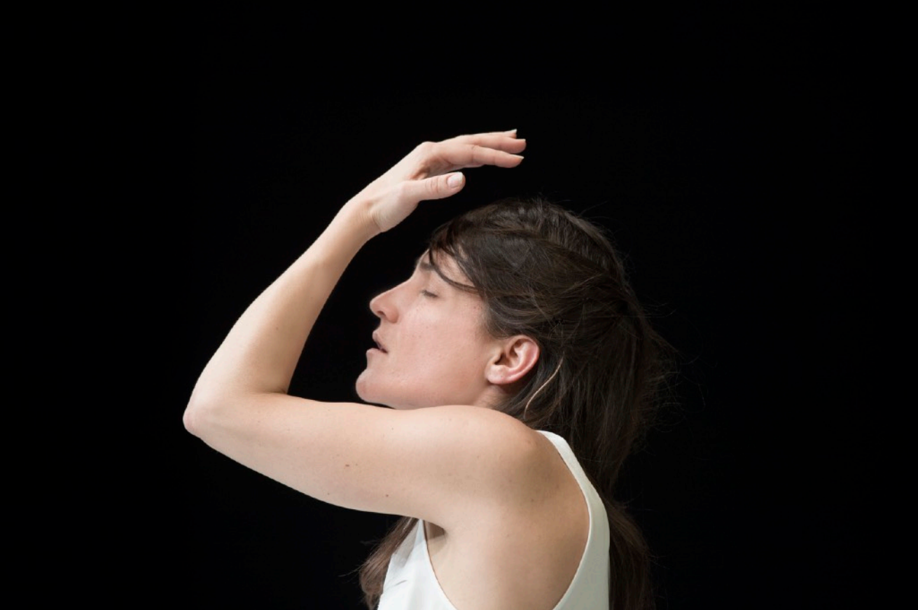
Yasmine Hugonnet, Se Sentir vivant , 2017