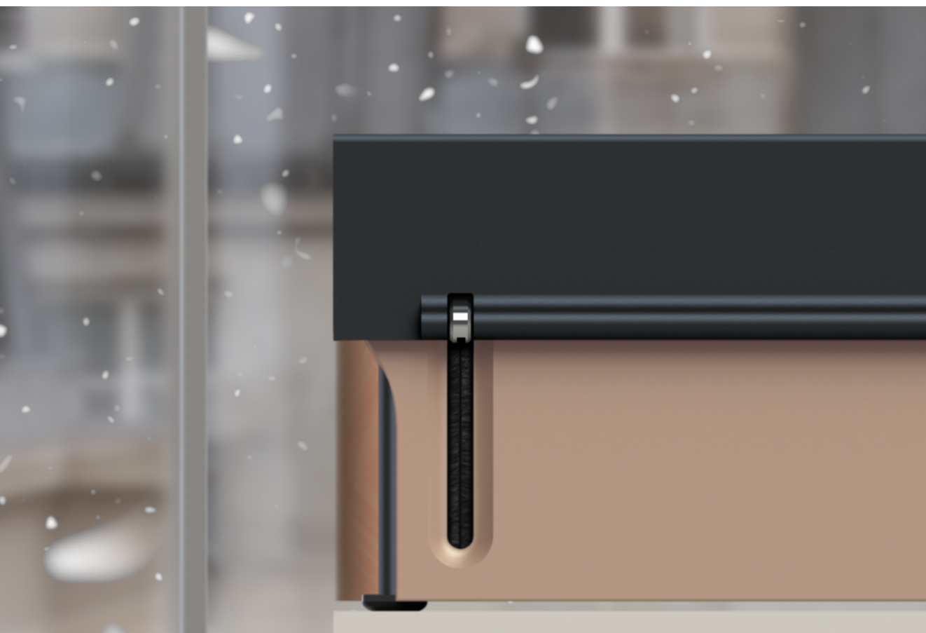
Camille Blatrix, sans titre (détail), 2019